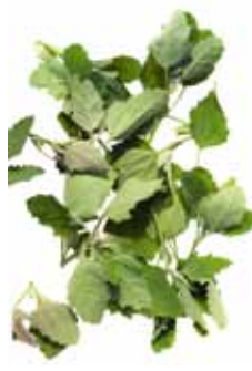
Weisse Melde, Weisser Gänsefuss