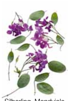
Silberling, Mondviole, Silberblatt