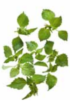
Bewimpertes Knopfkraut, Franzosenkraut