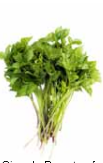
Giersch, Baumtropf, Geissfuss