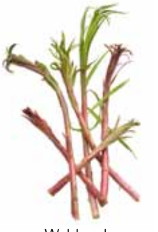
Wald- oder Schmalblättriges Weidenröschen, Stauden-Feuerkraut