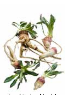
Zweijährige Nacht- kerze, Schinkenwurz, Gelbe Rapunzel, Nachtschönheit