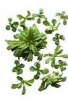
Feldsalat, echter Ackersalat, Rapunzel, Nüsslisalat

Text: Simon Bühler